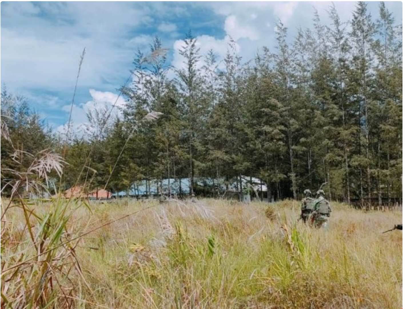
Satgas Yonif 323 Amankan Anggota OPM terduga pelaku tindak Kriminal

Satgas Mobile Yonif 323/Buaya Putih Kostrad berhasil menangkap salah satu anggota Organisasi Papua Merdeka (OPM) yang diduga terlibat dalam sejumlah tindak kriminal di wilayah Papua, Kabupaten Puncak, Penangkapan ini dilakukan